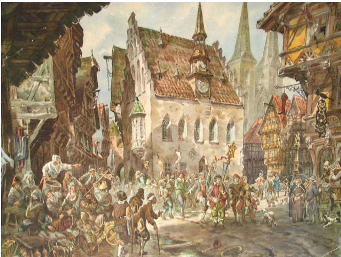
Приложение 1. Картина «В средневековом городе».

http://ikeakatalog.ru/149/152/52928.html